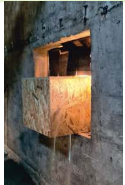
Nichoir n° 1

Le premier nichoir a pu être installé dans un bâtiment inoccupé de la Communauté Religieuse Cité Marcel Van à Argancy, qui a été sensible à l'opération et qui a eu la gentillesse d'accepter cette mise en place. Le site est tout à fait adapté à l'oiseau, car le nichoir est orienté côté Moselle, vers un territoire de vergers et de prairies, qu'affectionnent particulièrement les chouettes effraies pour y capturer les rongeurs, qui constituent la majorité de leur régime alimentaire.