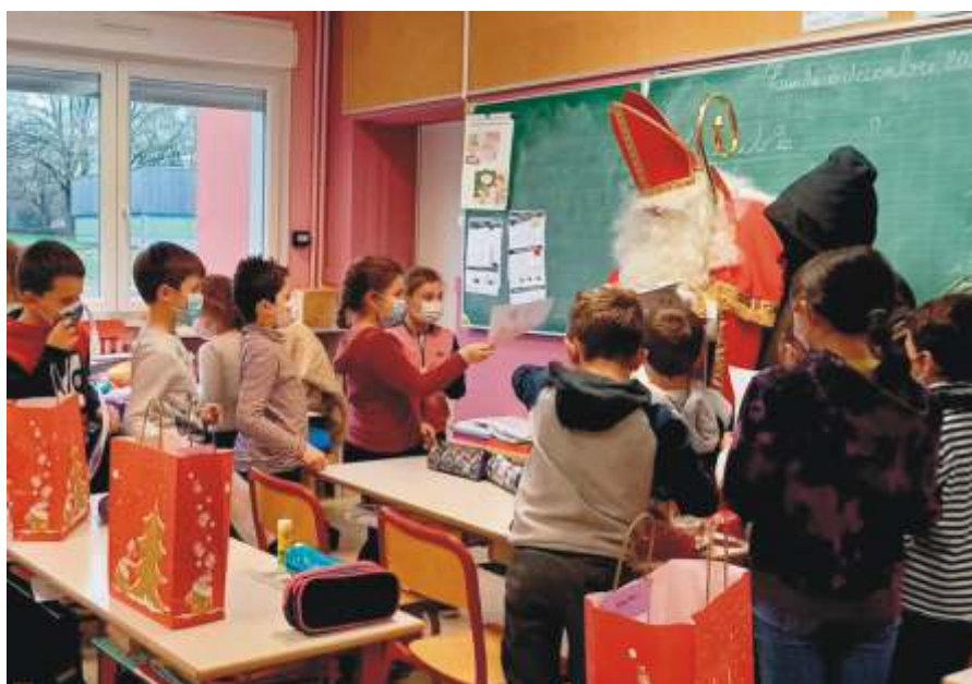
Remise de jolis dessins par les élèves de la classe de Mme Tazi Zerbin.