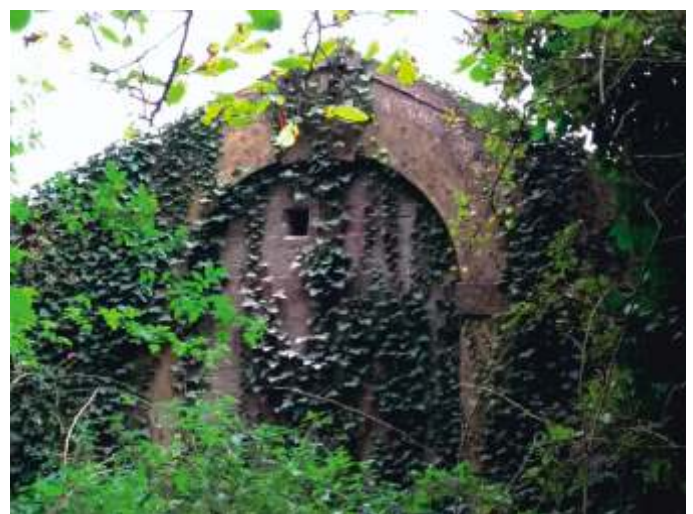
Trou d'envol du nichoir n° 2