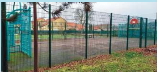
City stade à Rugy

Le conseil municipal s'étant réuni le 3 décembre 2021, et à l'unanimité sur proposition de la commission jeunesse, décide de mandater l'agence départementale MATEC pour l'étude de la rénovation et de l'amélioration du city stade de Rugy et du skate park d'Argancy.