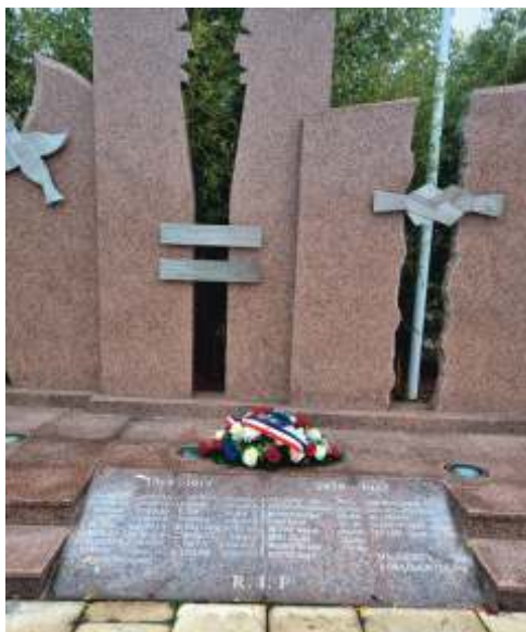
Une gerbe a été déposée au monument aux morts d'Argancy.

11 novembre 1918, armistice de la première guerre mondiale