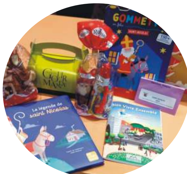
Livres et friandises offerts par Saint Nicolas et la municipalité.

Saint Nicolas et Père Fouettard n'ont pas oublié non plus de se rendre à l'école privée Marcel Van où 4 enfants scolarisés au sein de cet établissement, n'ont pas manqué de les accueillir chaleureusement par des chants très bien interprétés et dont Saint Nicolas a été fort touché.