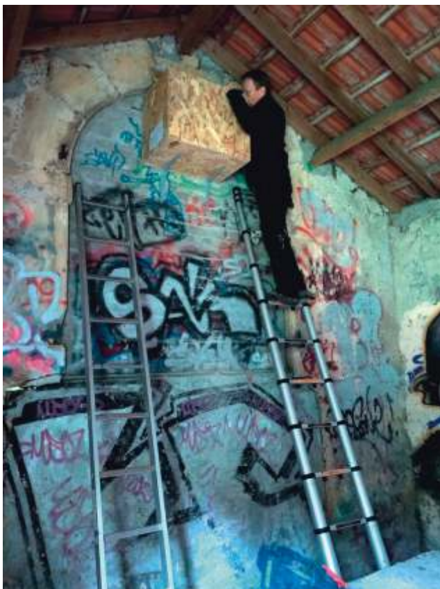
Pose du nichoir n° 2 au lavoir