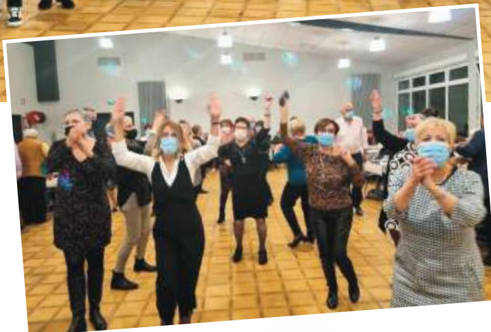
Merci à tous ces danseurs responsables qui ont gardé leur masque.