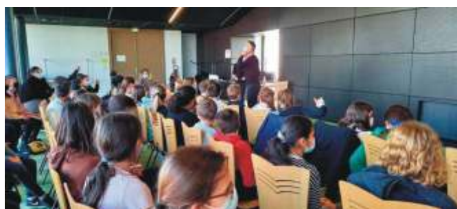
Le nombre de doigts levés montre l'intérêt porté par les élèves à cette manifestation.