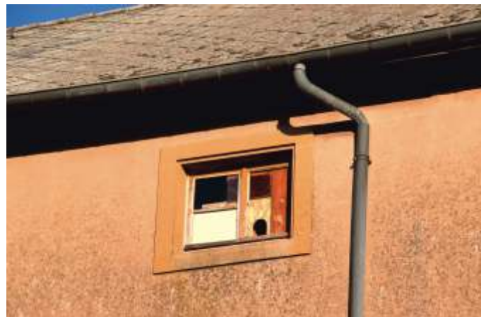
Trou d'envol du nichoir n° 1 en bas à droite de la fenêtre

Il ne reste plus qu'à surveiller et à espérer que des couples de chouettes effraies acceptent de venir emménager dans ces emplacements.