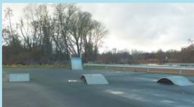
Skate park près de la salle des fêtes